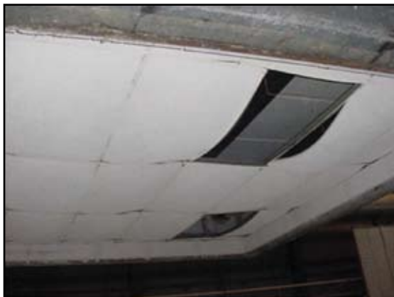
Foto – Verlaagd plafondsysteem na afloop van de brandproef.